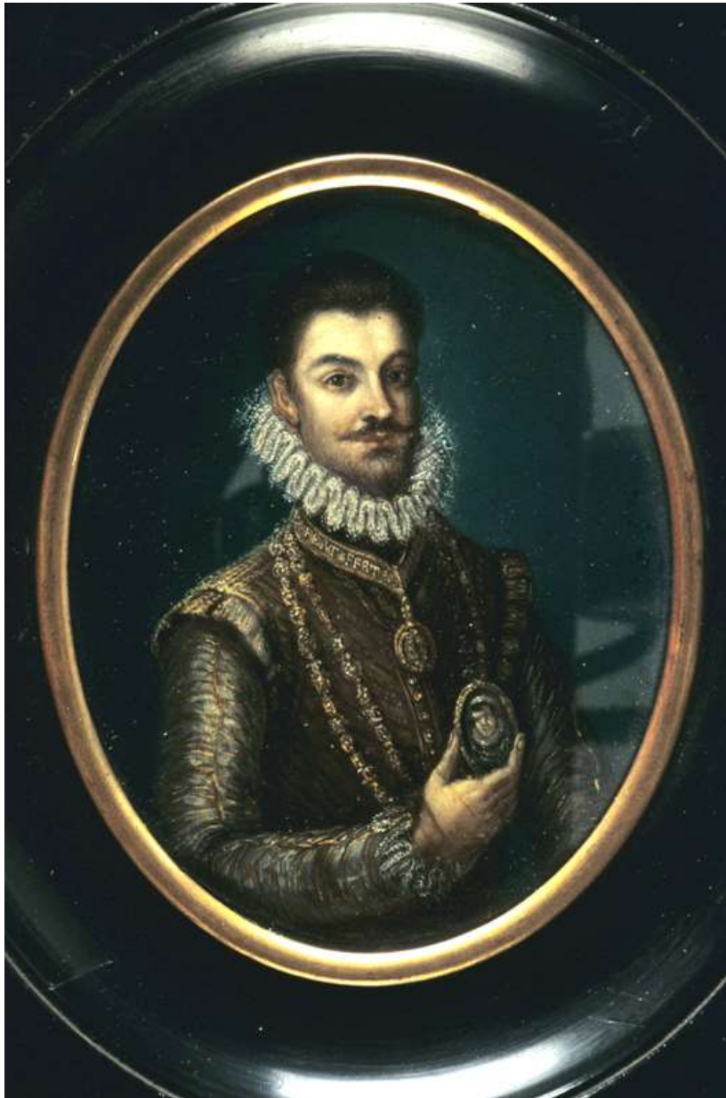
Portrait d'Emmanuel-Philibert