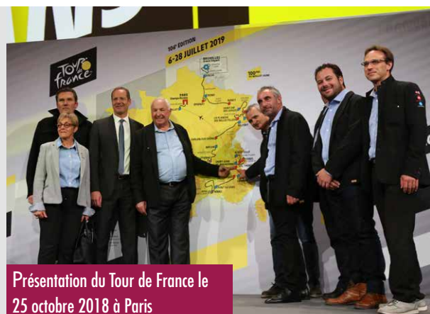
Présentation du Tour de France le 25 octobre 2018 à Paris