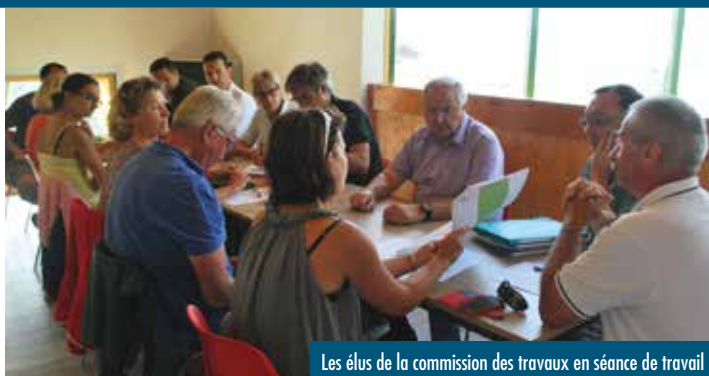
Les élus de la commission des travaux en séance de travail

Ils se répartissent en 6 principaux domaines d'activité qui sont : le développement touristique, l'environnement, le cadre de vie/l'espace public, l'aménagement du territoire, l'immobilier et le patrimoine remarquable.