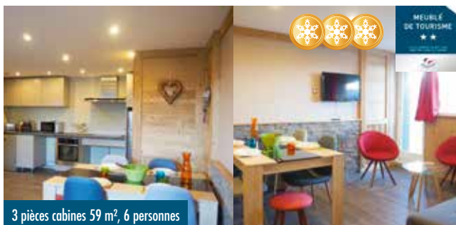
3 pièces cabines 59 m², 6 personnes