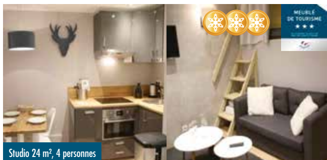
Studio 24 m², 4 personnes