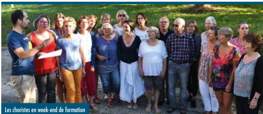
Les choristes en week-end de formation

Lors de sa création en 1975 par l'Abbé Maurice Romanet, la Chorale des Belleville comptait 8 choristes... Aujourd'hui, cette jeune dame dynamique porte le nom de "Bellevill'Voix" et regroupe une trentaine de chanteurs, venus de toute la vallée et de Moûtiers, heureux de se retrouver pour progresser ensemble.