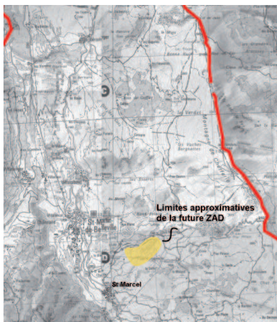
Localisation de la future ZAD de la Léchère.